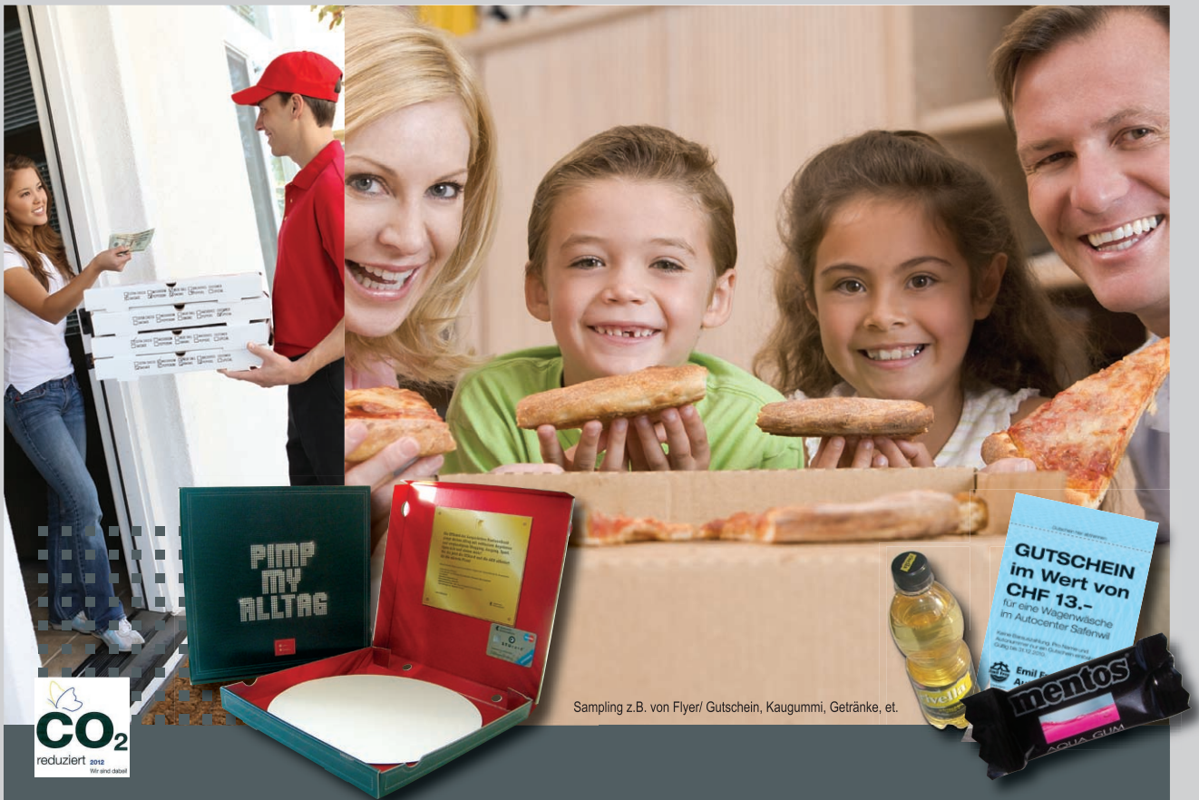
Sampling z.B. von Flyer/ Gutscheine, Kaugummi, Getränke, et.