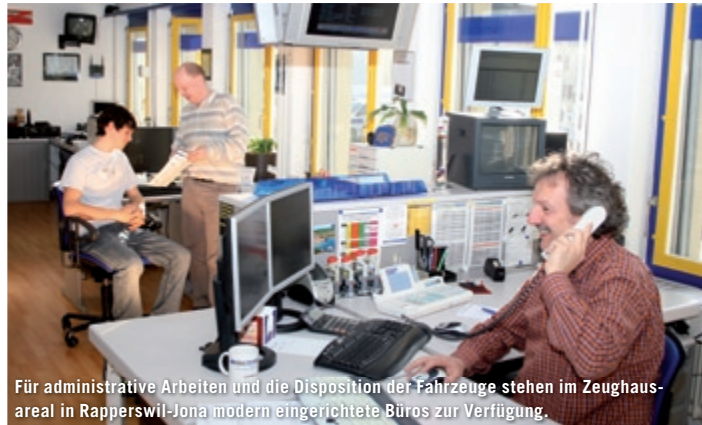
Für administrative Arbeiten und die Disposition der Fahrzeuge stehen im Zeughaus-areal in Rapperswil-Jona modern eingerichtete Büros zur Verfügung.

Die ständige Verfügbarkeit der Fahrzeuge und des Personals benötigen eine flexible und